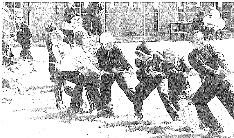
Le Forum des associations a mis en exergue les locaux de la rue de la République, véritable ruche associative avec entre autres le recyclage, la gym pour le troisième âge et les différentes formes de boxe, dont la française... Le stade Georges Carnus accueille aussi les jeux sportifs des primaires.

Les structures municipales sont nombreuses et de qualité. Régulièrement entretenues, remises en état, elles sont jalosées par les communes voisines. Pour une commune de 9 400 habitants, la ville compte parmi les complexes sportifs des plus enviables avec trois stades pelousés et deux terrains de foot en stabilisé, un complexe dédié au tennis avec ses six terrains entièrement rénovés. Le personnel de la commune entretient aussi deux boulodromes et, après la rénovation de la buvette, des travaux d'aménagement vont démarrer dans les prochaines semaines pour améliorer le confort des boulodromes Goulrand et Pucetti. Les Gignacais pratiquent désormais leurs activités sportives sur deux city stades. La mairie a souhaité améliorer le confort des pratiquants en posant des pelouses synthétiques. Le plateau sportif de la pinède Pagnol a donc été entièrement rénové début octobre et un nouveau terrain polysport a vu le jour cet été à proximité du centre aéré. Enfin, côté sportif, la ville compte deux gymnases polyvalents à la Viguière et à la Pousaraque permettant aux publics scolaires et associatifs de disposer d'équipement de qualité dans des domaines divers (sports de combat, danse, sports collectifs).