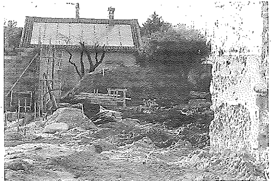
Le chantier du futur square en plein centre ville.