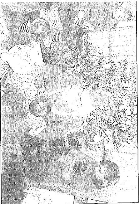
Cadeaux, sachets de friandises, le Père Noël a gâté les "P'tits Loups".