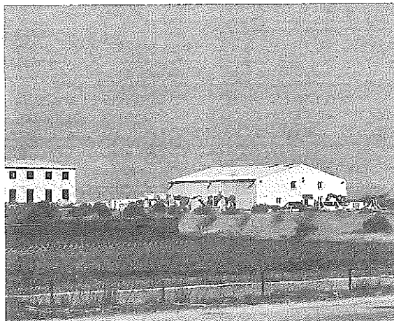
Le CLSPD au grand complet pour traiter des occupations illégales sur les terres agricoles. J.M.

rons rien et on l'a bien vu depuis au moins vingt ans. Les moyens de la police (notamment) vont être ici accentués. Nous sommes sur un territoire à fort enjeu environnemental et nous en faisons désormais un lieu d'expérimentation ».